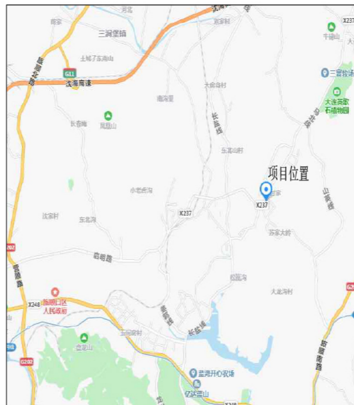
主要技术经济指标