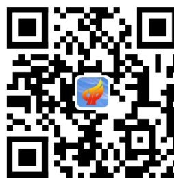
高新区财政金融局地图导航