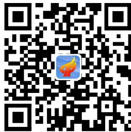
中介机构从事代理记账业务审批流程图