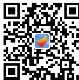
财政权力事项清单