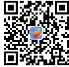
办事不找关系路径