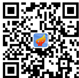
代理记账行政审批事项告知承诺书

②主管代理记账业务的负责人具备会计师以上专业技术职务资格或者从事会计工作不少于三年的书面承诺（可缺，但2个月内检查，材料齐全）