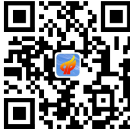
高新区财政金融局地图导航