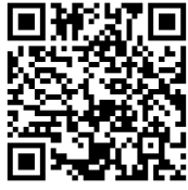
高新区市场监管局政务服务办事地址及电话