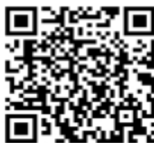
大连高新区社会组织网上申报操 作说明