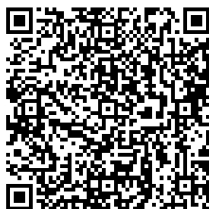
大连高新区公开募捐资格 审核材料目录