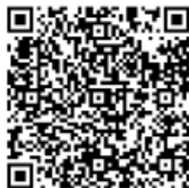
大连高新区社会团体变更 法定代表人材料目录