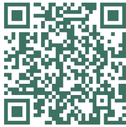
建档立卡信息登记表

规格为 352 像素（宽）*440 像素（高），JPEG 格式，分辨率 300DPI，大小为 20-50K（并提供一张同版纸质照片）