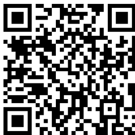
2.互联网上网服务营业场所经营单位变更审批

2.3 办理时限 ：6 工作日办结（不含特殊环节对现场条件进行勘验和公示期时间）