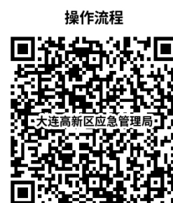
3. 除剧毒化学品、易制爆化学品外其他危险化学品（不含仓储经营）经营许可证变更

https://zwfw.dl.gov.cn/dlPortal/item/toDetails/d137bcee-2775-4380-9bf8-bdc9147b6775