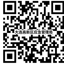
应急局权力事项清单