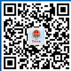
大连税务企业号二维码