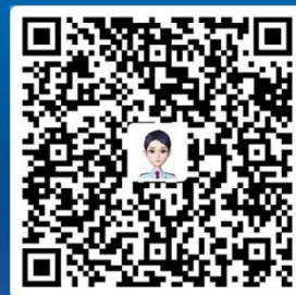
爱连·塔可思（安卓版）二维码