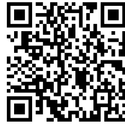
高新区行政服务厅（派出所）窗口